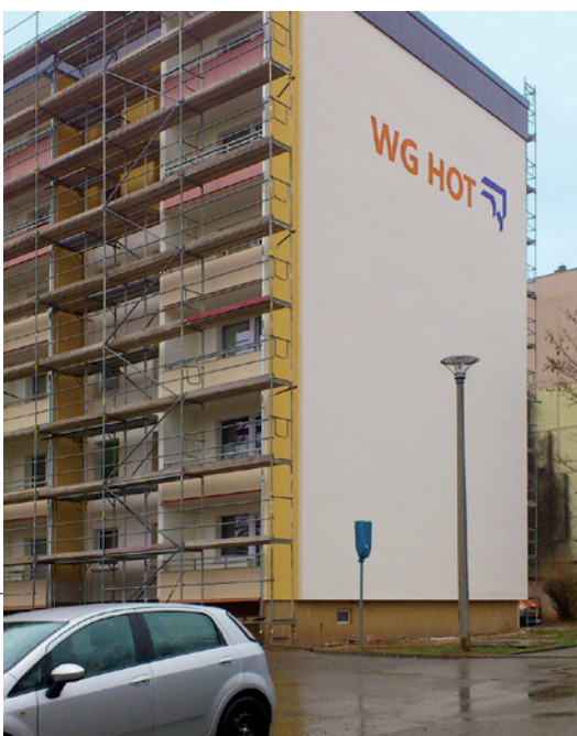
Fassadenarbeiten Sonnenstraße 38-41