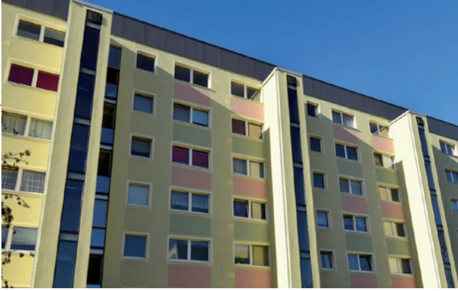
Aufzugsanbau Südstraße 33-35

Im späten Frühjahr begann der Anbau von Aufzügen am Haus Südstraße 33-35. Fast gleichzeitig startete die energetische Sanierung des Hauses Sonnenstraße 38-41 und der Einbau eines Aufzuges im Haus 41. Der i-Punkt des Projektes sind die Haltestellen unmittelbar vor den Wohnungseingangstüren. Im Eingang 41 werden zusätzlich Wohnungen mit neuen Bädern, Küchen und neuen Grundrissen entstehen.