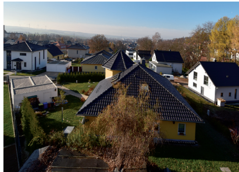
Wohngebiet an der Pölitzstraße

Unser Projekt zur Erschließung des Eigenheimstandortes zwischen der Pölitz- und der Turnerstraße konnte mit dem Verkauf des letzten freien Grundstückes im Jahr 2018 erfolgreich abgeschlossen werden.