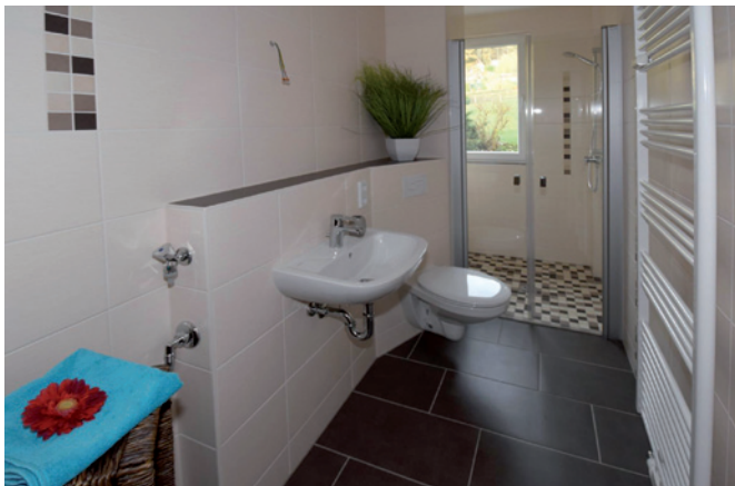
Beispielbad mit bodengleicher Dusche

Insgesamt 3,7 Millionen Euro hat die Wohnungsgesellschaft in diesem Jahr in ihre Objekte investiert. Dabei standen die Modernisierung und die Instandhaltung des Wohnungsbestandes im Vordergrund. So wurden zahlreiche Wohnungen vor ihrer Neuvermietung saniert. Aber auch Bäder, Wohnungstüren, elektrische Anlagen, Steigleitungen für Warm- und Kaltwasser, Fußböden und Heizkörper wurden in den Bestandswohnungen erneuert.