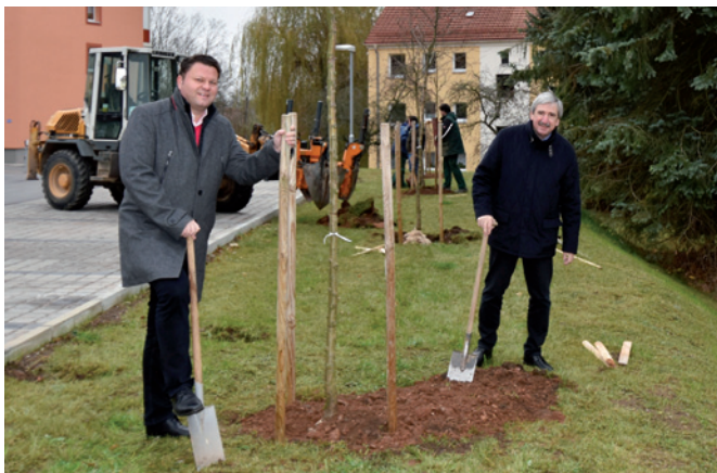
Baumpflanzung in der Fritz-Heckert-Siedlung

Seit Januar dieses Jahres kann der Parkplatz in der Fritz-Heckert-Siedlung genutzt werden. Kürzlich wurden hier noch 5 Bäume gepflanzt.